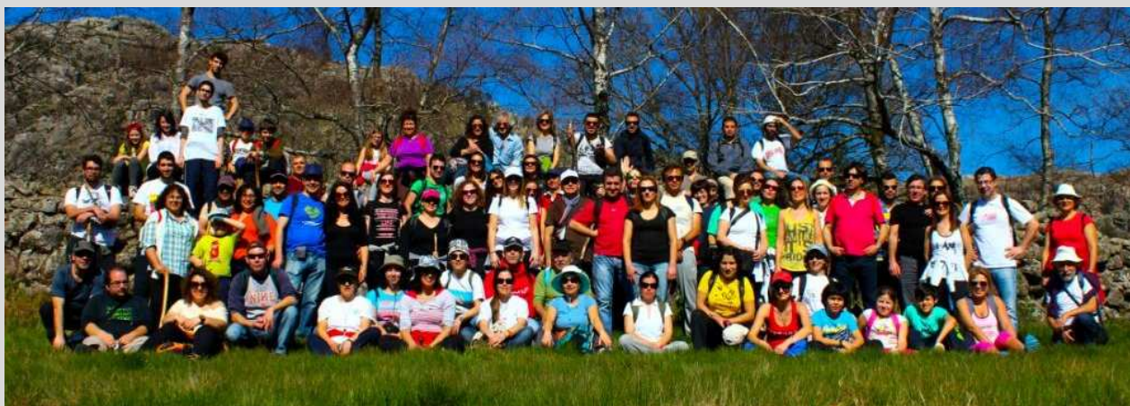
Sobreiral da Ermida do Gerês - 16 março

Correspondendo às expectativas de um considerável número de associados, neste ano realizamos nove caminhadas, promovendo e divulgando valores ambientais entre os participantes através do contato com a natureza.