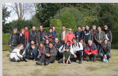
Pousada da Costa - 14 dez.