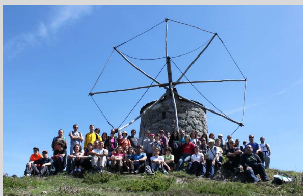
Lagoa e Aboim - 1 maio