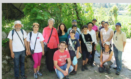
Feira da Terra - 12 julho