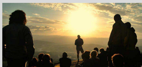
Ave, solstício e a Bicicleta - 21 junho