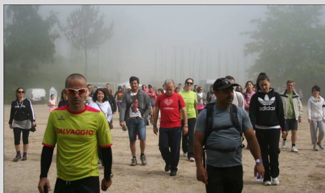
Trial da Penha da ERDAL - 10 maio