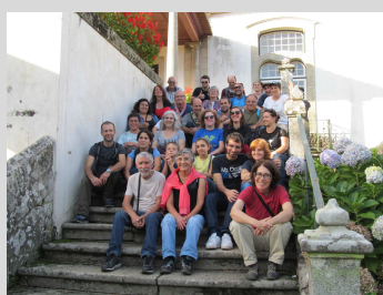
Tibães - 19 outubro