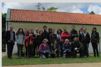
Caldelas - 7 junho