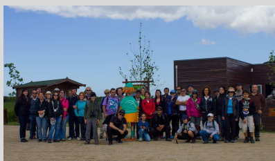
Bioria - 24 maio