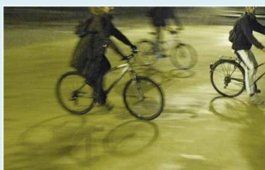
Proposta de um Plano de Mobilidade Ciclável para Guimarães AVE - Associação Vimaranesse para a Ecologia