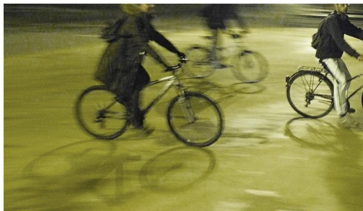
Proposta de um Plano de Mobilidade Ciclável para Guimarães AVE - Associação Vimaranesse para a Ecologia

A AVE esteve também representada nos seguintes corpos consultivos: