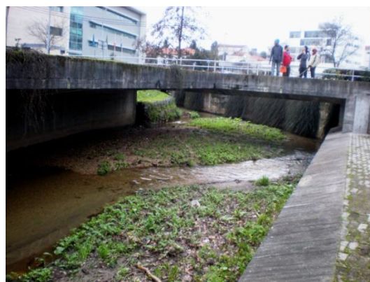
Aspectos do diagnóstico fotográfico da ribeira de Couros (2010/2011)