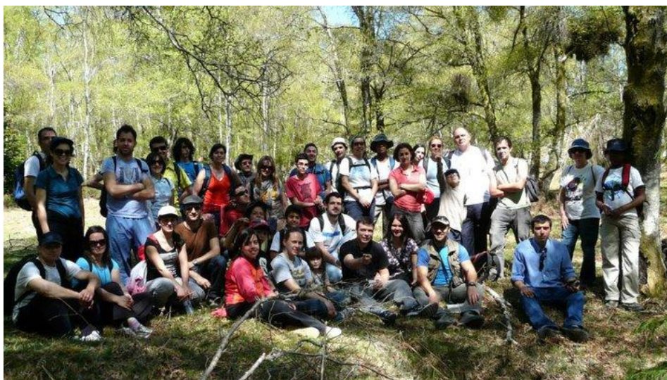
Percurso da nascente do Ave na serra da Cabreira, no 10.º aniversário da associação (10-04-2011).