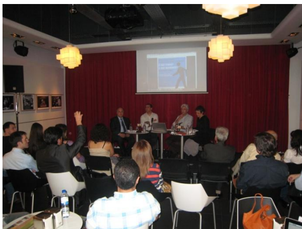
Conferência sobre mobilidade e transportes públicos no Fórum Fnac Guimarães (8-04-2011)