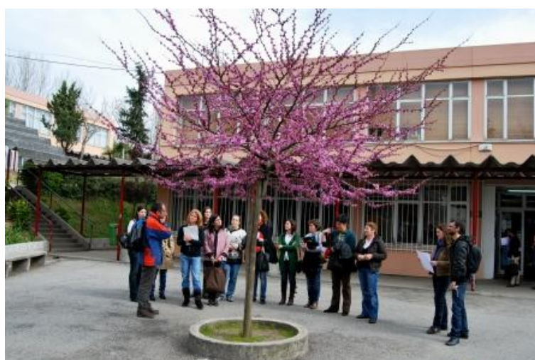
Oficina das árvores na escola EB 2,3 Afonso Henriques (11-03-2011)

Dirigidas ao público mais jovem, estas atividades têm incidido sobre a descoberta do meio envolvente, a observação e identificação de elementos naturais (flora e fauna), a construção de ninhos artificiais e comedouros para aves, a realização de herbários e a sensibilização para comportamentos mais ecológicos. Foram realizadas oficinas de formação, como a Oficina das árvores , para professores do ensino básico e secundário, e a Oficina de jardinagem , destinada a um público mais abrangente.